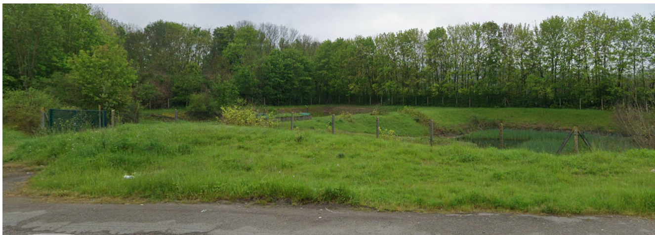
Photo des bassins 47 G01 et G01Bis